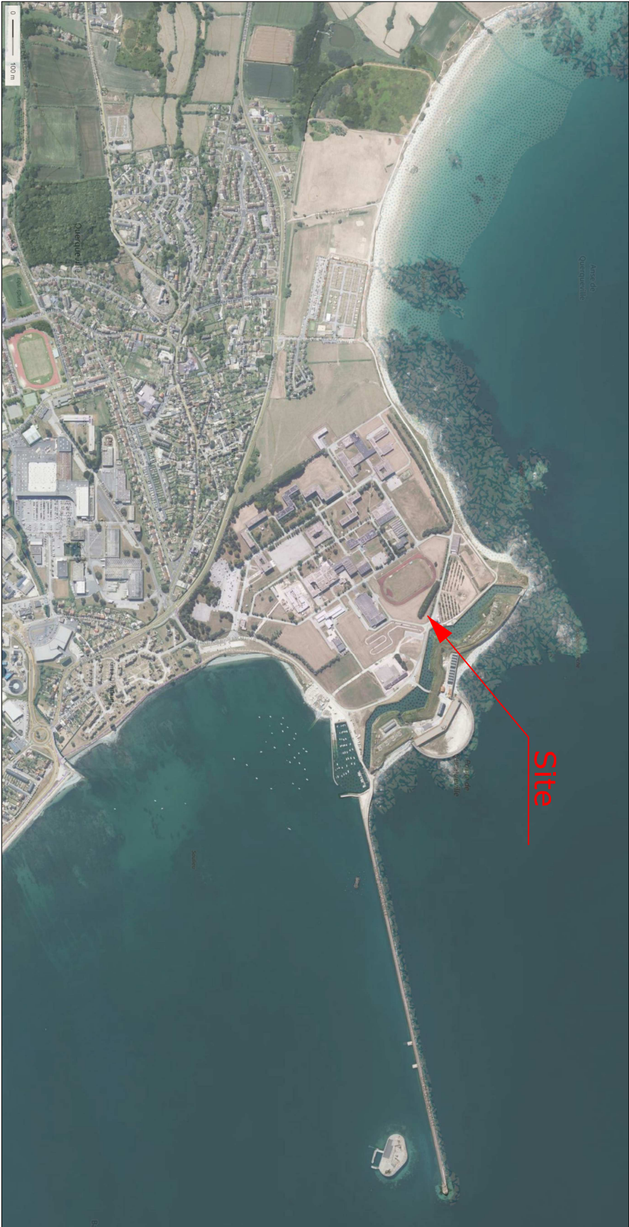
Vue aérienne - échelle graphique